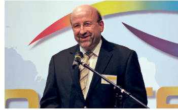
Remagens Bürgermeister Herbert Georgi