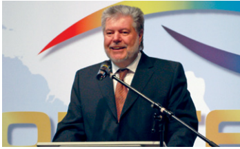
Ministerpräsident von Rheinland-Pfalz Kurt Beck