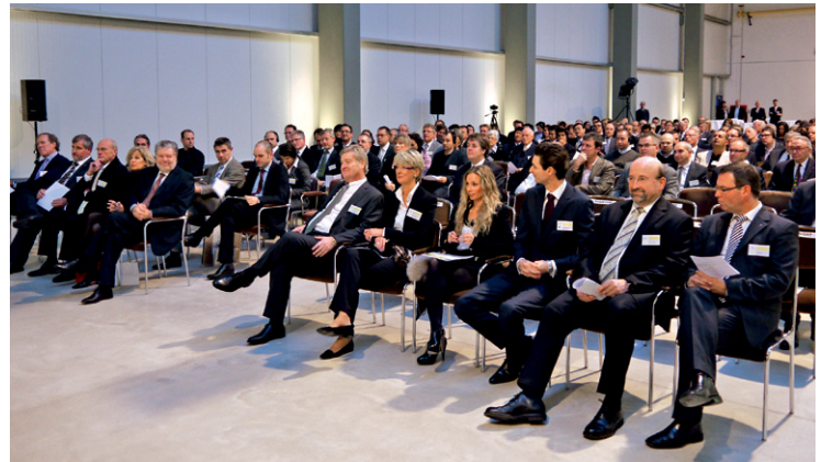
Nicht nur aus Europa, sondern auch aus Australien, Japan oder Südafrika kamen die Gäste zur Einweihung am Standort Remagen, die direkt neben der neuen Beschichtungsanlage stattfand.

BILDQUALITÄT ODER GESCHWINDIGKEIT? DER EFI RASTEK ERMÖGLICHT BEIDES!